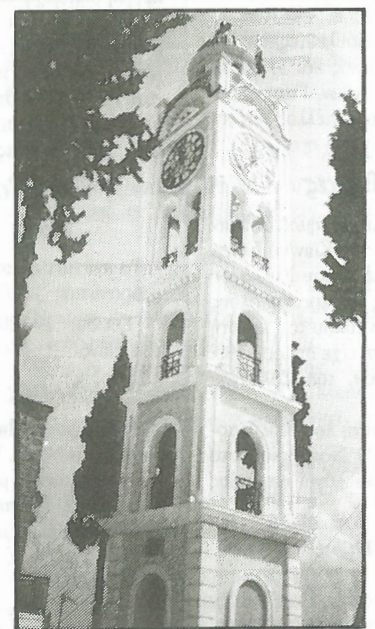
Το καινούργιο campanario. Η φωτογραφία είναι από το καλοκαίρι. Όμως αυτό που ήταν το κάτι άλλο, ήταν το Χριστουγεννιάτικο χιονισμένο campanario. Δυστυχώς δεν έχουμε ανάλογη φωτογραφία.

Το χωριό φόρεσε τα γιορτινά του για να γιορτάσει τα Χριστούγεννα. Στις πλατείες στολιστήκαν φυσικά δένδρα χριστουγεννιάτικα με τη φροντίδα της Κοινότητας και του Συλλόγου μας. Επίσης στα καφενεία, στις ταβέρνες και στα σπίτια φεγγολούσαν τα Χριστουγεννιάτικα δέντρα και ακούγονταν οι μουσικές χριστουγεννιάτικες μελωδίες. Όλα ήταν όμορφα. Όμως οι προβληματισμοί για το αν θα άνοιγαν τα μπλόκα των αγροτών δημιούργησαν στον κόσμο ανησυχία και πάρα πολλοί μετέβαλαν τον προγραμματισμό τους για την επαρχία και προτίμησαν να μείνουν στα σπίτια τους. Αυτό είχε και για το χωριό μας τη συνέπεια της επίσκεψης πολύ λίγων συγκωριανών μας. Βέβαια και κάποια οικονομική κρίση στις αγροτικές παραγωγές μείωσε αισθητά τη κίνηση στο χωριό μας. Πάντως όσοι βρέθηκαν στο χωριό πέρασαν καλά και στο τέλος απόλαυσαν και τα χιόνια που έπεσαν τη δεύτερη μέρα.